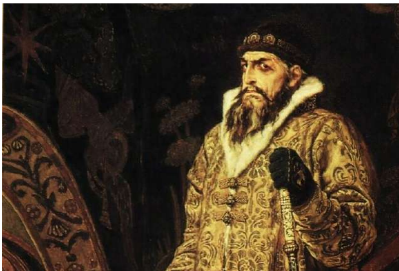
Царь Иван Грозный

Но все это было едино разовой службой, вольные донские казаки не подчинялись ничьим указом, и это было большой проблемой. Совсем недалеко от Москвы существовало сильное, отлично вооруженное войско, которое в любой момент могло начать войну против правителей. Разумеется, они боялись этого и всячески задабривали казаков — посылали им еду, одежду, материалы для строительства, оружие. Но с другой стороны жалобы на казаков поступали со всех сторон.