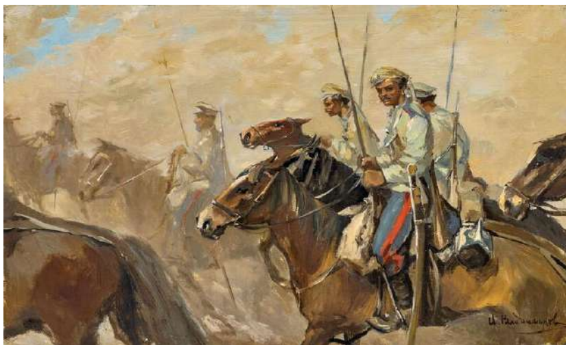
Картина, изображающая донских казаков

Это наиболее многочисленные представители казачества. Одни из первых упоминаний о них относятся к 1550 году, когда князь Юсуф писал письмо Ивану Грозному, жалуясь на поведение казаков с Дона. Казаки разрушали поселения, грабили их, творили разные бесчинства.