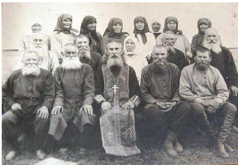
Донские казаки долгое время были старообрядцами