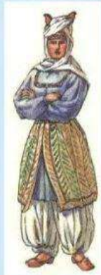
Верхнедонская казачка в XVII веке.