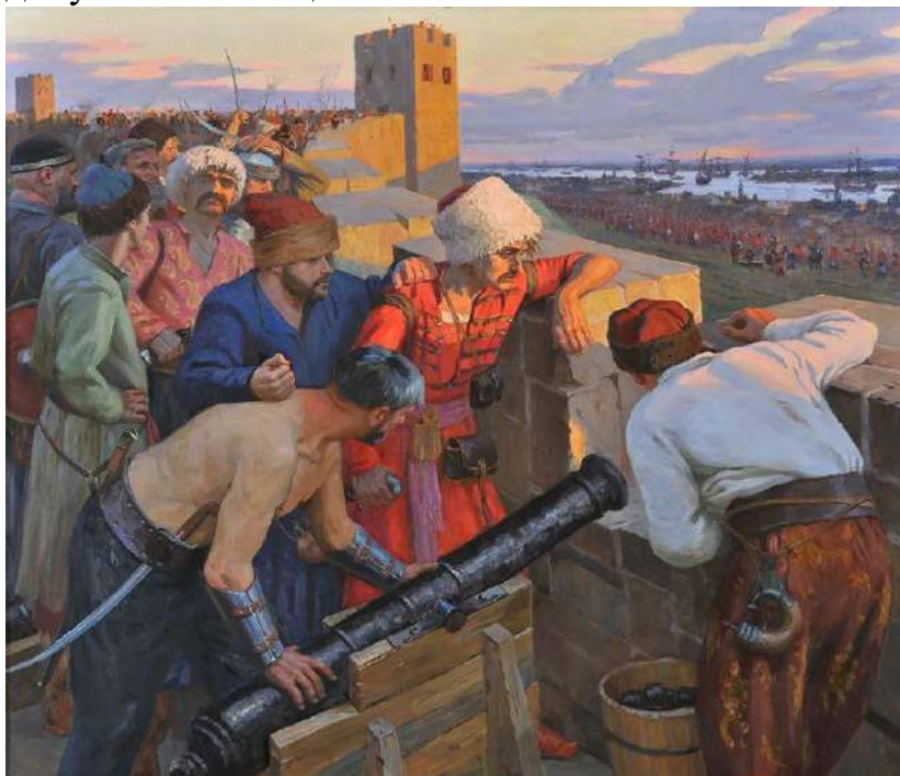
Азовское сидение донских казаков 1637-1642гг.

пускали врагов в город долгие пять лет. Если перед нападением турецких войск в Азове проживало около 1000 представителей казачества, то к началу осады там было уже 4500 человек. Казаки съезжались со всех территорий страны, несмотря на то, что турки делали все возможное, чтобы не допустить помощи казакам.