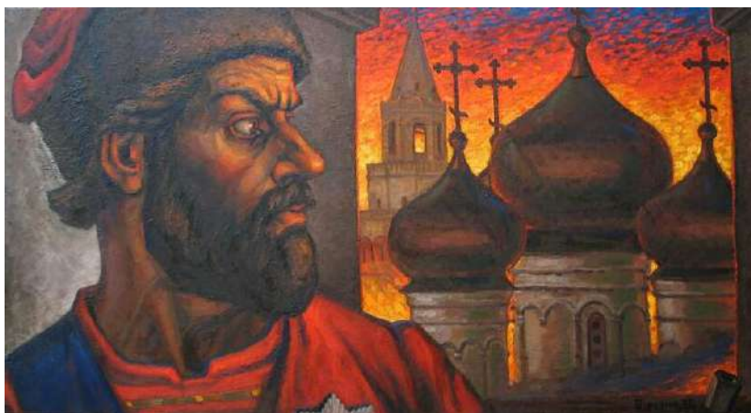
Один из самых известных донских казаков Емельян Пугачев

некоторые казачьи воины стали переходить на его сторону.