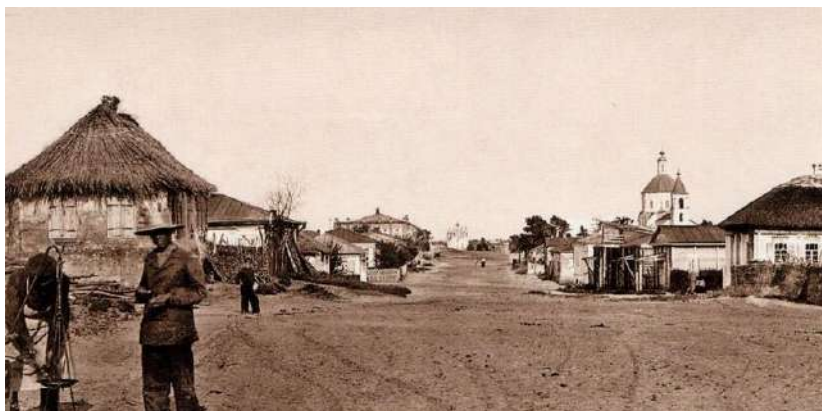
Архитектура станицы донских казаков

Поселения донских казаков получили название станицы, оно сохранилось и до наших дней. Дома назывались курени.