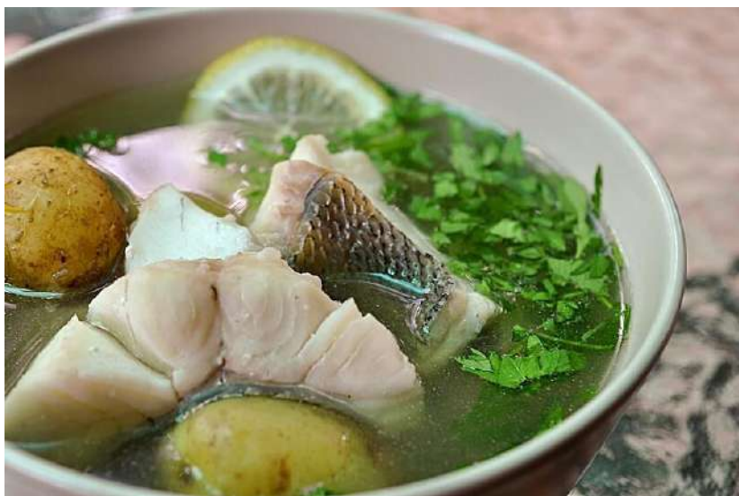
Уху казаки всегда готовили из нескольких видов рыбы

Также донские казаки любили похлёбки, щи, супы из баранины и свинины.