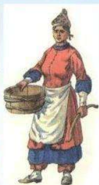
Нижнедонская казачка в повседневном костюме. XVII век.