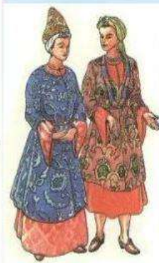
Казачка-вдова и девушка. XVII- XVIII века.