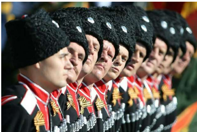
Фото донских казаков