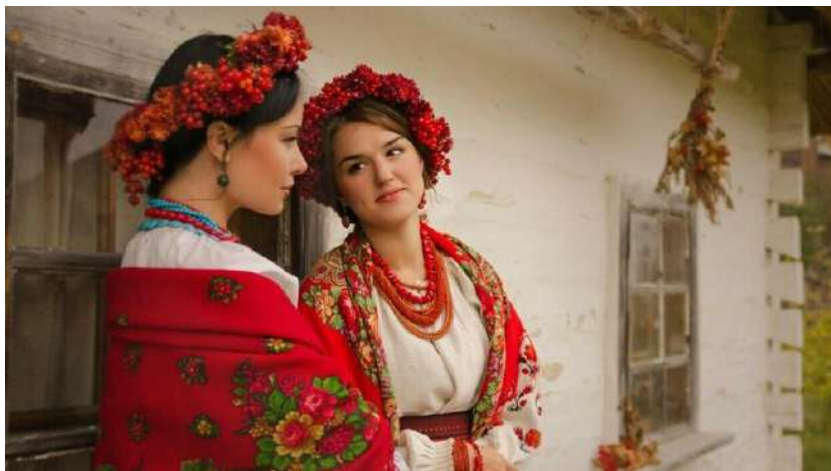
Жены донских казаков

Изначально женщины занимались домом, огородом, воспитанием детей, но затем казаки разглядели, насколько отважные и храбрые их вторые половины. Они стали наравне с мужчинами обращаться с оружием, скакать на конях, принимать участие в боях.