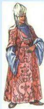
Жена старшины в праздничном наряде. XVII- XVIII века.